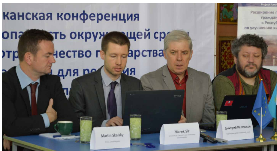
Особый интерес - к результатам отбора проб

> О результатах проекта, Программы малых грантов и результатах отборов проб на загрязненных территориях со-