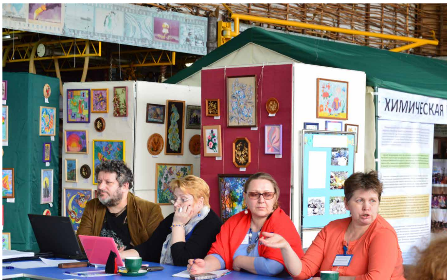
Обсуждение плана дальнейших действий

«Расширение прав и возможностей гражданского общества в Республике Казахстан для улучшения химической безопасности»