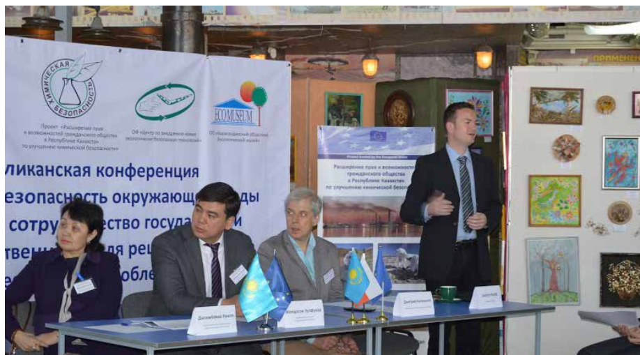
Республиканская конференция в Караганде

ЭкоМузей на конференцию с разных городов Карагандинской, Акмолинской и Восточно-Казахстанской областей. В мероприятии приняли участие представители международных организаций, местных органов власти, сотрудники НПО и бизнес-компаний, работающих в сфере обеспечения химической безопасности окружающей среды в Республике Казахстан.