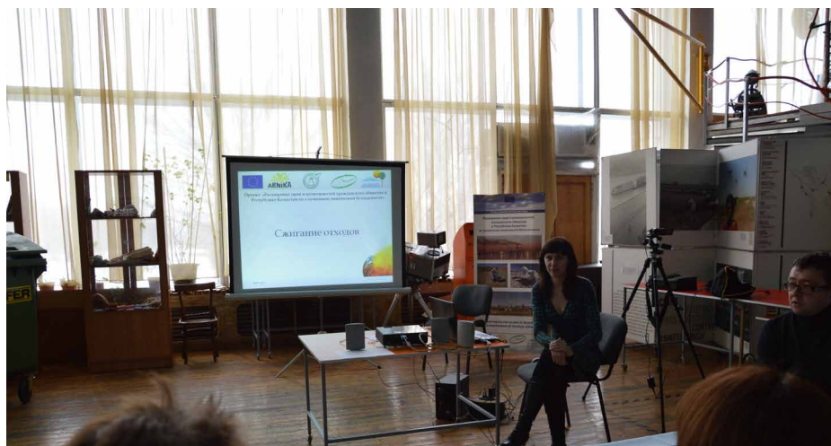
На заседании экологического некафе

> 27 марта в зале ЭкоМузея за чашкой кофе представители